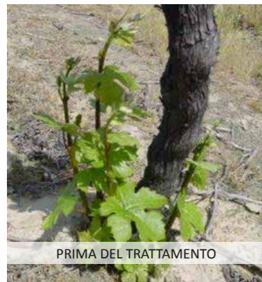
PRIMA DEL TRATTAMENTO