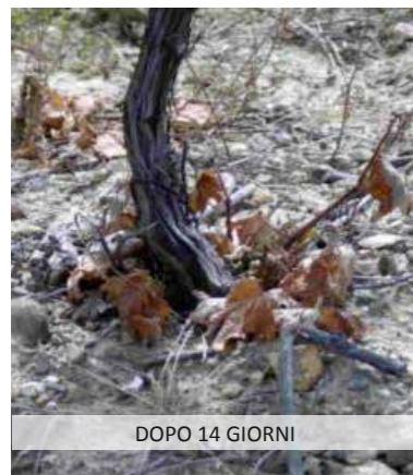
DOPO 14 GIORNI