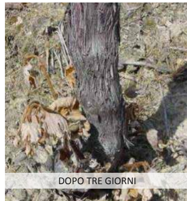
DOPO TRE GIORNI

Per il controllo dei getti basali e del tronco intervenire alla dose di 0,3 litri per 100 litri d'acqua avendo cura di bagnare bene la vegetazione da eliminare. Distribuire una dose massima di 0,9-1 L/ha di prodotto.